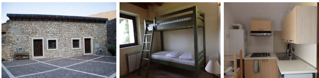
Foresteria di Aia delle Piagge, via Piagge snc, 67030, Anversa degli Abruzzi (AQ).

Il Comune e la Riserva Naturale Gole del Sagittario mettono a disposizione alloggi confortevoli in cui ospitare i volontari nel paese di Anversa degli Abruzzi.