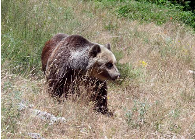
Marsican brown bear.