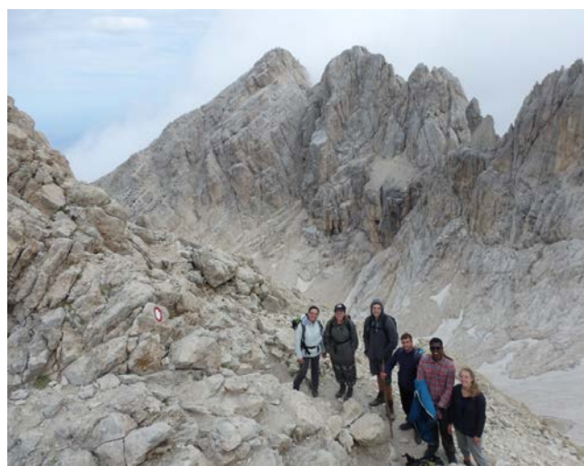
Parco Nazionale del Gran Sasso