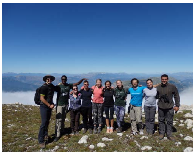
Parco Nazionale della Majella