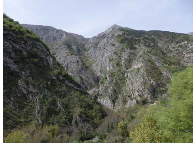
Una veduta della Riserva Naturale Gole del Sagittario.