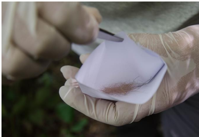
Raccolta dei segni di presenza..