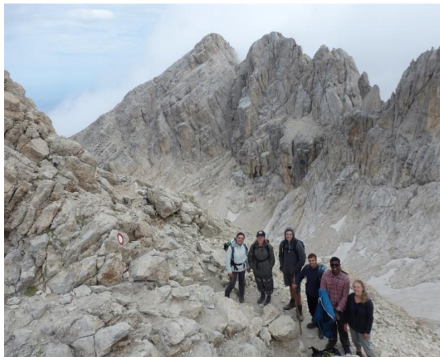
Parco Nazionale del Gran Sasso.