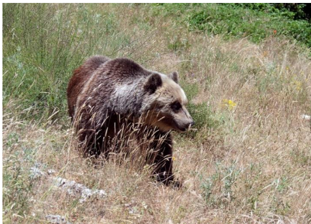
Orso bruno marsicano.