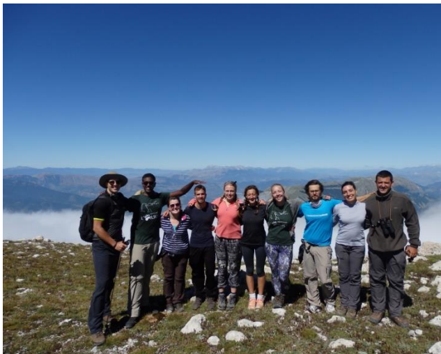
Parco Nazionale della Majella.