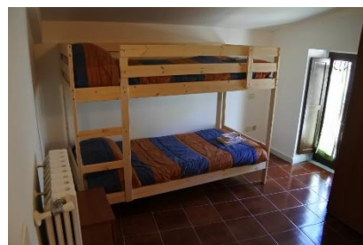
Foresteria in Rua Frisciotta 2, 67034, Pettorano sul Gizio (AQ).