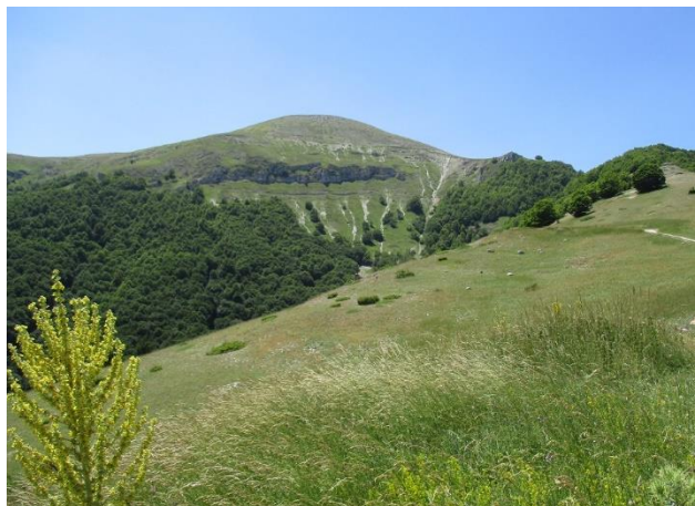
Una veduta della Riserva Naturale Monte Genzana.