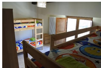
Foresteria "Pajare" in via Scalelle snc, 67034, Pettorano sul Gizio (AQ).