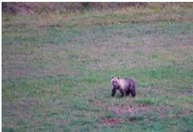
Orso bruno marsicano