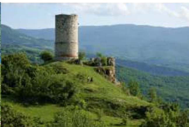
Sperone, frazione di Gioia dei Marsi