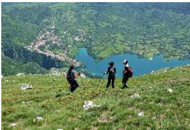
Lago di Barrea, PNALM