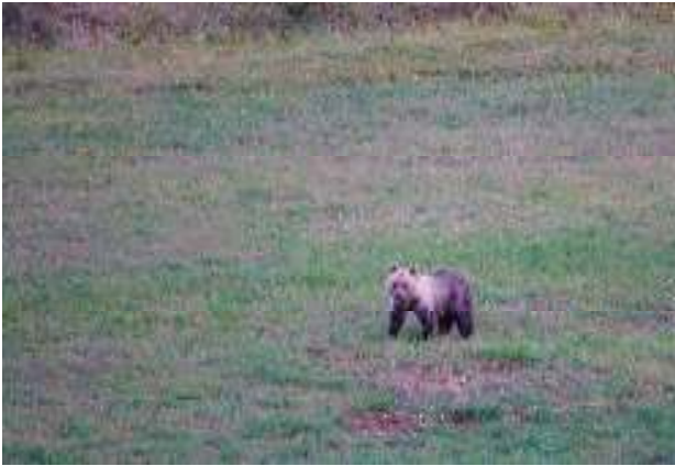
Orso bruno marsicano