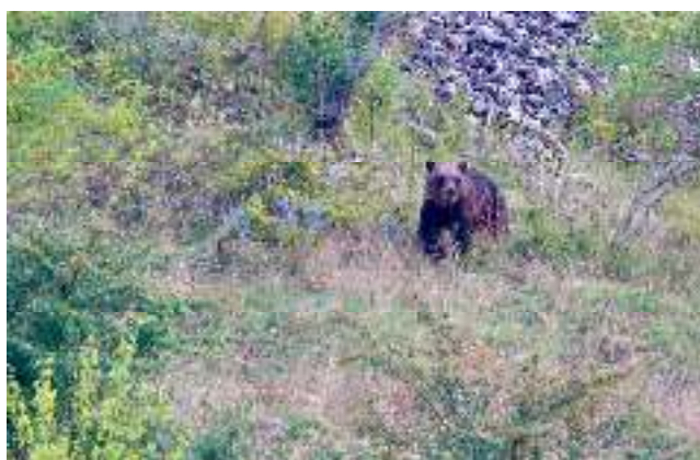
Orso bruno marsicano