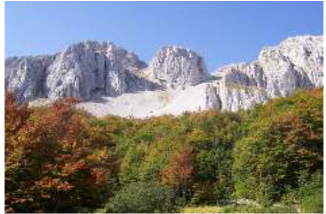
Parco Regionale Sirente Velino