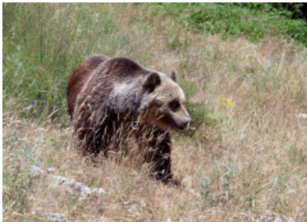
Orso bruno marsicano.