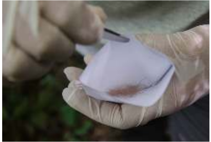
Raccolta dei segni di presenza..