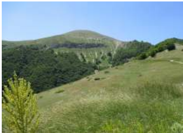
Una veduta della Riserva Naturale Monte Genzana.