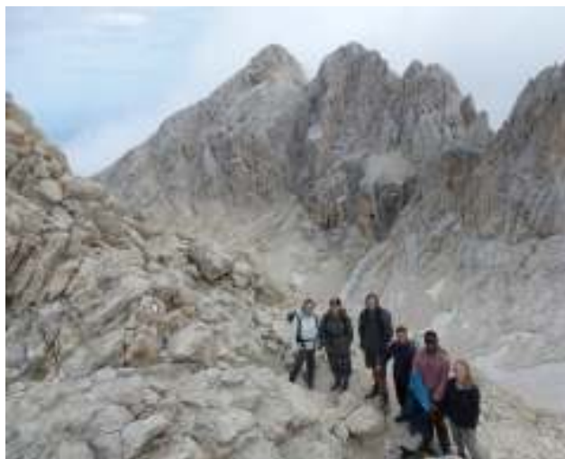
Parco Nazionale del Gran Sasso.