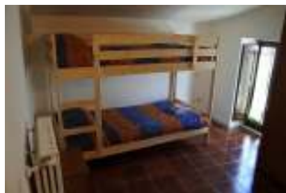
Foresteria in Rua Frisciotta 2, 67034, Pettorano sul Gizio (AQ).