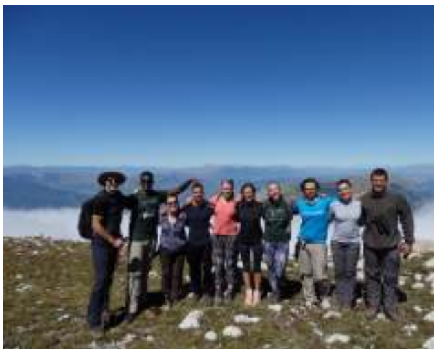
Parco Nazionale della Majella.