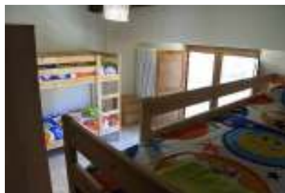
Foresteria "Pajare" in via Scalelle snc, 67034, Pettorano sul Gizio (AQ).